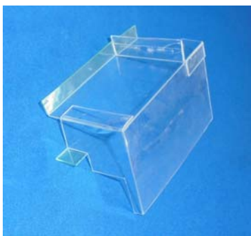
MK P 8 5 J / MK P 8 5 J (2)

サブ基板上部異物挿入防止カバー MK P 8 5 J ・ MK P 8 5 J (2)