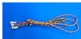
専用渡り配線付属

今般、パチンコ台にて「どつき行為」によるゴト被害が多発しています。多くの遊技台では振動センサーが内蔵されていますが、検知しない程度で加減される等発見が困難な場合もあります。ロジック内蔵型高感度振動センサー「VB-1」は遊技台裏パックに貼り付けるだけで、「微弱振動」や「振動のベクトル（方向）」をキャッチし「どつき行為」の特性に合わせたロジック解析で監視します。ゴト行為と判断した場合にナンバーランプ等の周辺機器に報知するものです。