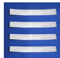
MKC-28N (2種1組 封印シール4枚付属)